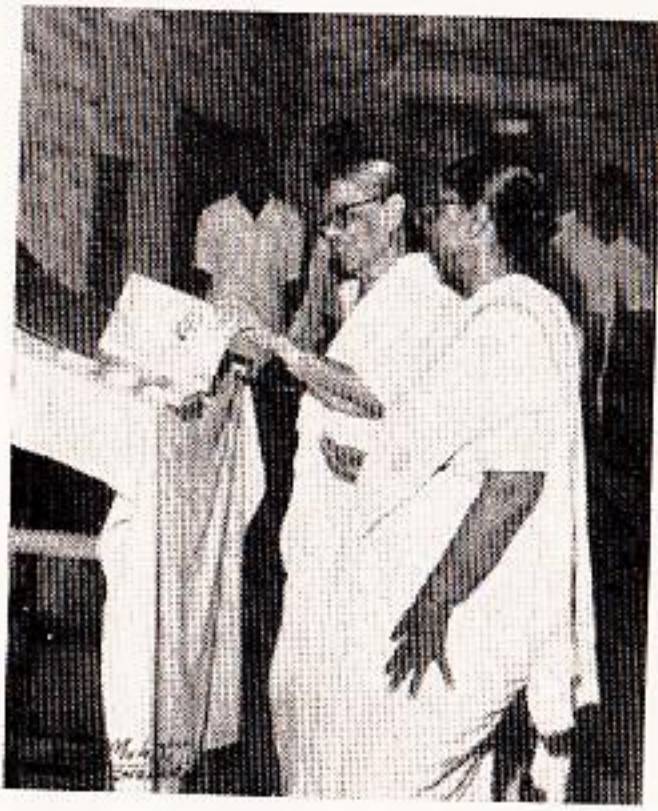
टेकडीवरची पुस्तकजत्रा : 'एक दिवस आपोआप मुलं पुस्तकांची मागणी करतील.'